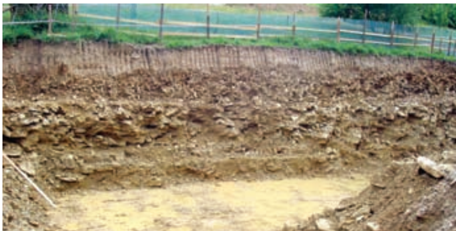
Pohled na stavební jámu dosazovacích nádrží v areálu ČOV