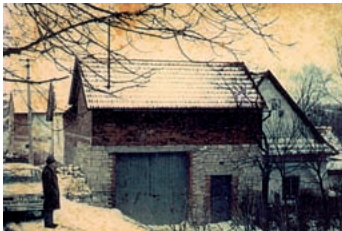
Chalupa č. 61 od západu v 60. letech 20. století