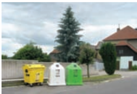
Sběrné místo na tříděný odpad před nákupním střediskem

- u přípojky, kde je potřeba čerpadlo, jsou pak tedy orientační náklady: 10\text{ m} * 800 - 1200\ \text{Kč/m} = 8\ 000 - 12\ 000\ \text{Kč} + \text{např. } 8\ 000\ \text{Kč} čerpadlo (cena za metr je nižší z důvodu menší světlosti potrubí např. DN 50, dále se nemusí kopat do velkých hloubek, potrubí stačí vést v nezámrné hloubce a nemusí se dodržovat spád. Jako čerpací jímku lze využít stávající jímku u objektu). Obecní úřad