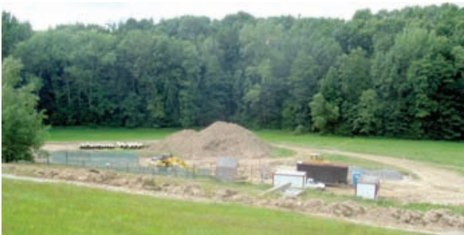
Celkový pohled na areál ČOV v Bořkově