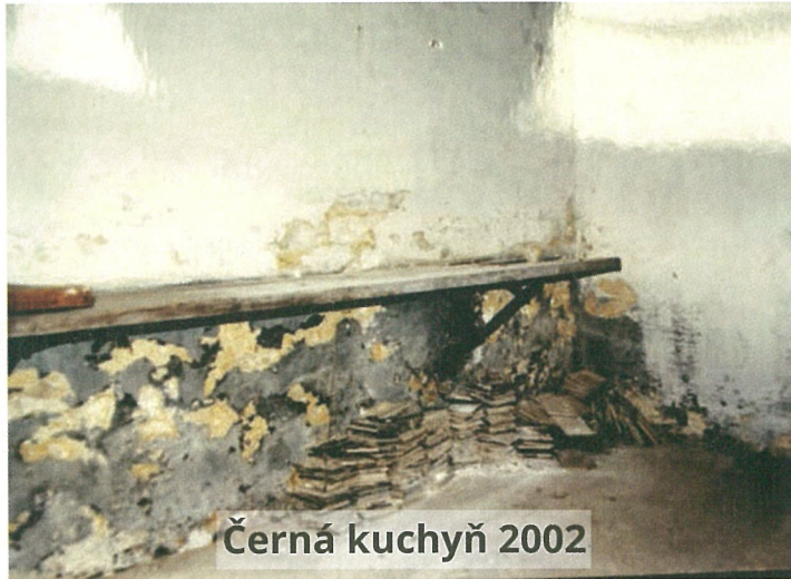
Černá kuchyň 2002