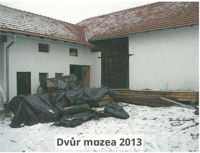
Dvůr muzea 2013