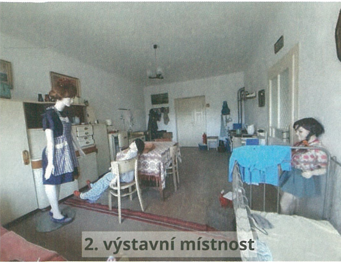
2. výstavní místnost