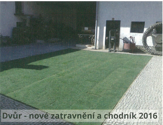
Dvůr - nové zatravnění a chodník 2016