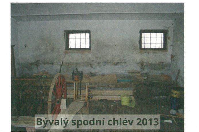
Bývalý spodní chlév 2013