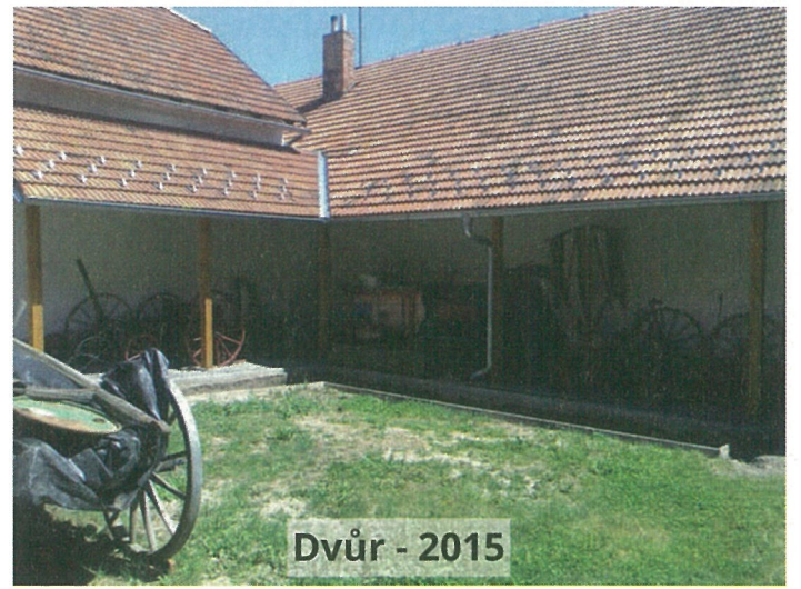
Dvůr - 2015