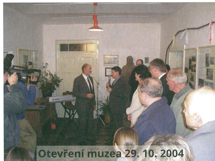
Otevření muzea 29. 10. 2004