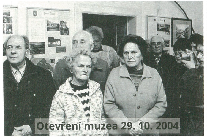
Otevření muzea 29. 10. 2004