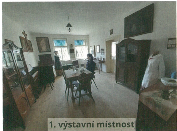
1. výstavní místnost