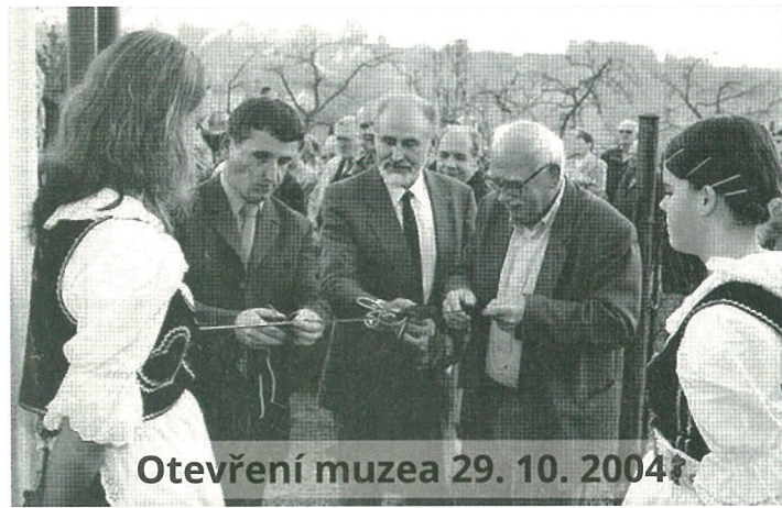
Otevření muzea 29. 10. 2004