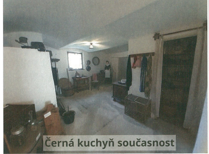
Černá kuchyň současnost