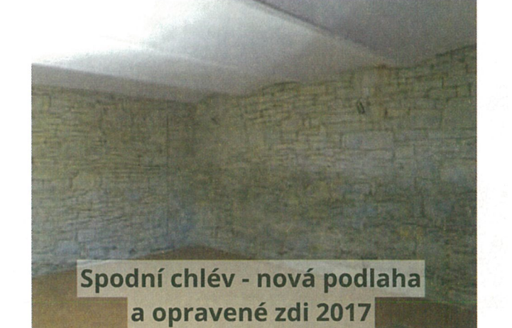
Spodní chlév - nová podlaha a opravené zdi 2017