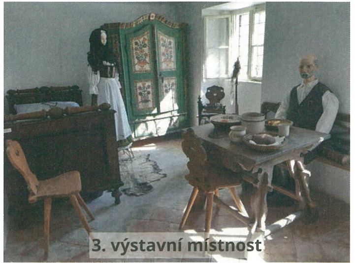
3. výstavní místnost