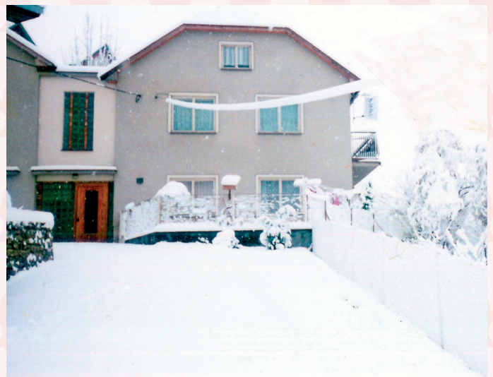
dům č. 293, současný stav