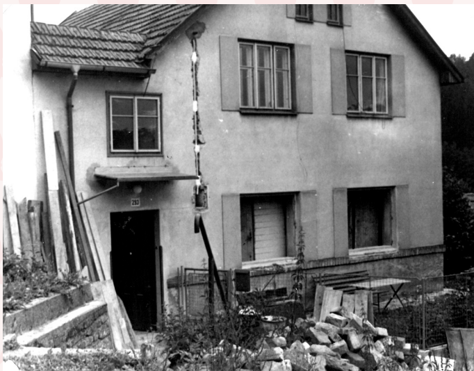
dům č. 293 v r. 1978