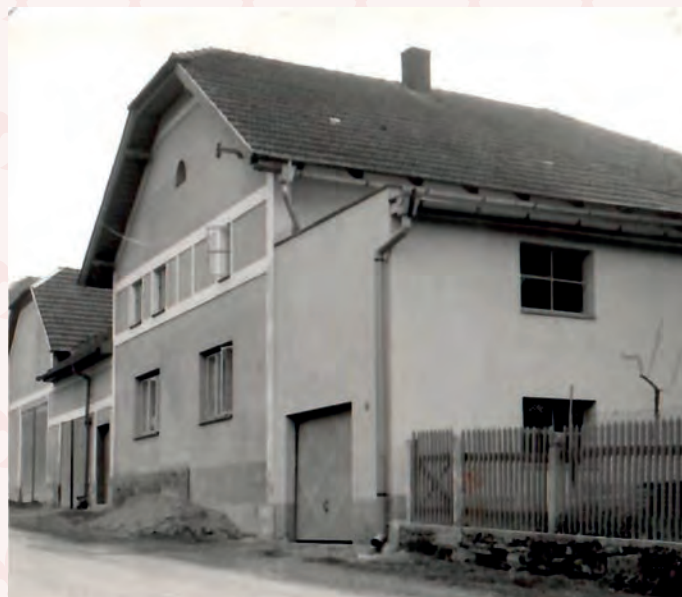
č.p. 289 současný stav