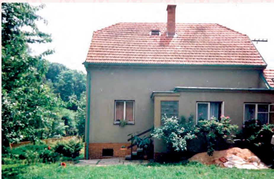
čp. 292 asi v roce 2010