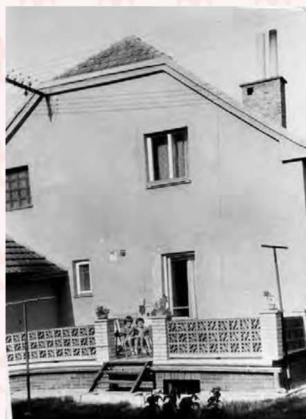
čp. 292 v roce 2010