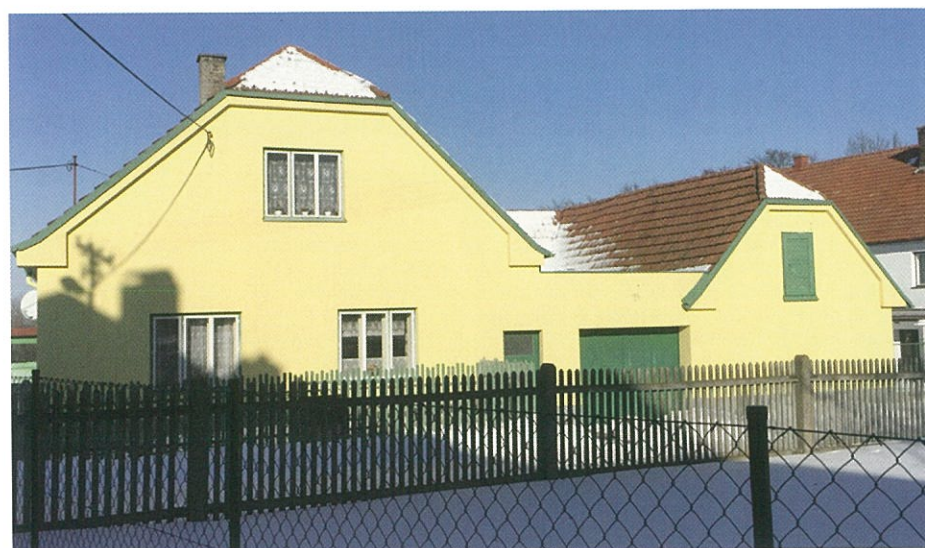
J.J. a Z.H. Současný stav č. p. 154