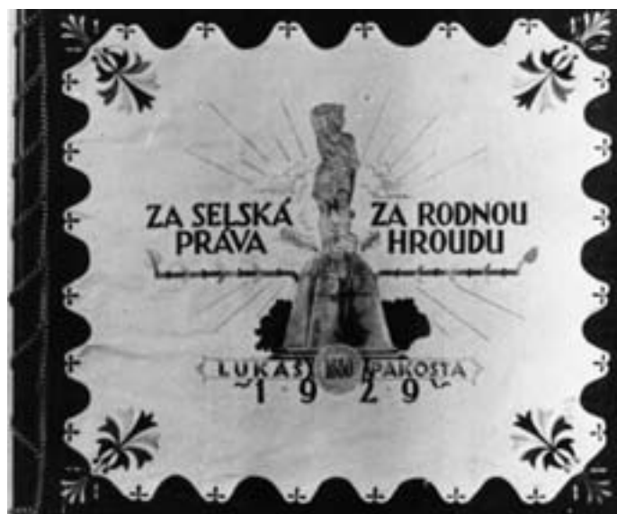
Symbol památníku na standartě Okresního sdružení republikánského dorostu na Krajiněské výstavě v Litomyšli v r. 1929