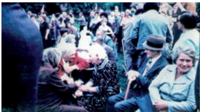
Z oslavy 300. výročí povstání v r. 1980 v Dolním Újezdě