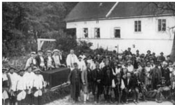
Divadelní představení r. 1930 v Horním Újezdě u Ležákova mlýna