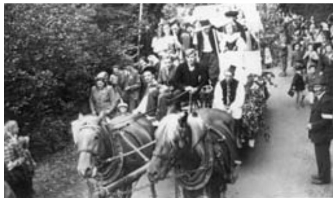
Průvod na oslavu 100. výročí zrušení roboty v Horním Újezdě u Ležákova mlýna