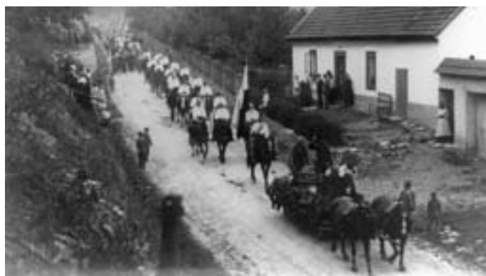
Oslava 250. výročí selského povstání v r. 1930. Za alegorii oráče selská jízda