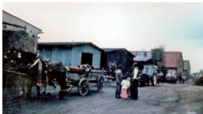
Z oslavy 300. výročí povstání v r. 1980 v Dolním Újezdě