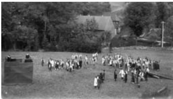
Divadelní představení Selská rebelie byla sehrána s velkým komparem na louce u Švejdova mlýna také v r. 1930