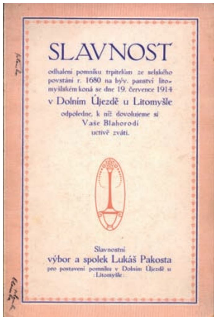
Pozvánka na odhalení pomníku selským trpětelům z r. 1914