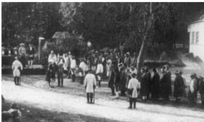
Divadelní představení r. 1930 v Horním Újezdě u Ležákova mlýna